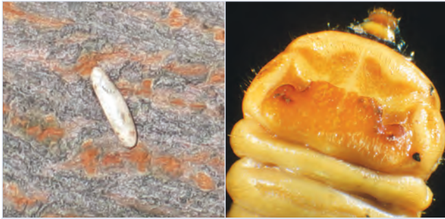
1. Reiskorngroßes Ei (7-8 mm)