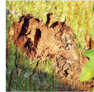
8. Larvenfraß unter der Rinde mit ovalem Einbohrloch der Larve