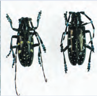
4. Erwachsene ALB, links Männchen, rechts Weibchen