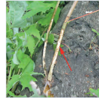
6. Reifungsfraß der Käfer an Ästen

Ausbohrlöcher: charakteristisch kreisrund, Durchmesser 1 - 1,5 cm (11).