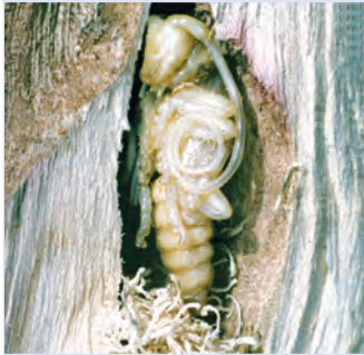
3. Puppe mit grobem Spanpolster in Puppenwiege