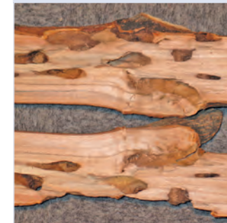
10. Breite Fraßgänge des ALB im Holzkörper