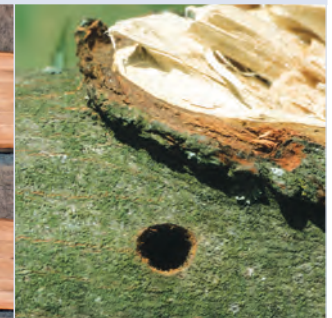
11. Kreisrundes Ausbohrloch

Befallssymptome sind an jungen Bäumen verhältnismäßig gut aufzuspüren. Bei Altbäumen mit dichtem Laub gibt letztlich nur die Inspektion in der Krone selbst, z. B. bei Baumpflegearbeiten, eine ausreichende Sicherheit. Selbst äußerlich vital erscheinende Bäume können Larven oder fertig entwickelte, schlupfbereite Käfer beherbergen.