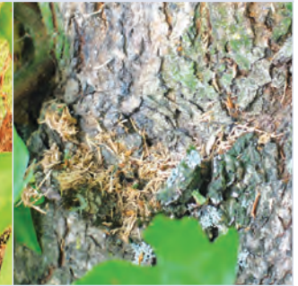
9. Von Larve ausgeworfene grobe Nagespäne