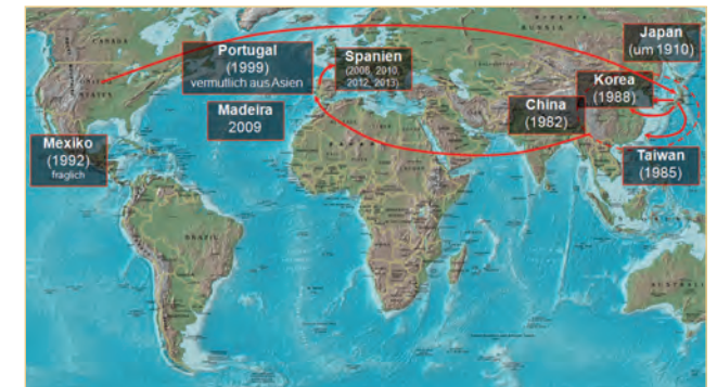
Weltweite Ein- und Verschleppungswege von B. xylophilus mit Jahr des Erstfundes