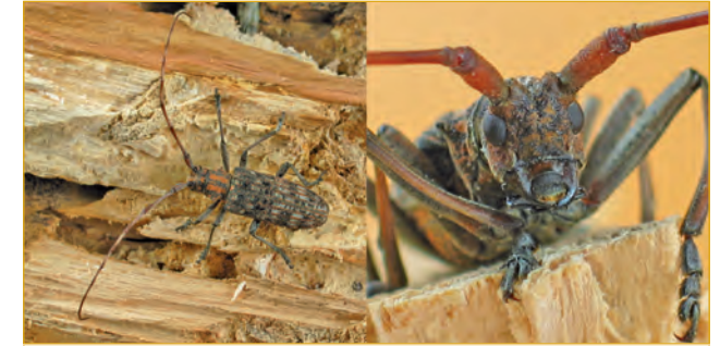
Monochamus alternatus : Vektorkäfer für den Kiefernholznematoden in Asien

Der Kiefernholznematode benötigt Bockkäfer der Gattung Monochamus als Vektoren, um neue Bäume zu besiedeln (siehe Zyklus). Während die Käfer schlüpfen und den Brutbaum verlassen, nehmen sie im Holz die Dauerlarven der Nematoden auf, die sich in ihren Atmungsorganen und unter den Flügeldecken einnisten. Beim Reifungsfraßes der Käfer an jungen Kiefernästen werden die Nematoden auf gesunde Bäume übertragen. Die Nematoden entwickeln sich im Baum, der in der Folge des Befalls abstirbt.