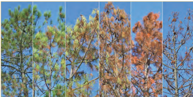
Schadssymptome an Pinus pinaster von gesund zu abgestorben

Ein Befall mit dem Kiefernholznermatoden führt zu pflanzenphysiologischen Reaktionen im Wirtsbaum, in deren Folge der Baum Welkeerscheinungen zeigt. Bei optimalen Temperaturen im Juli/August (Ø über 20 °C) stirbt ein befallener Baum innerhalb weniger Monate ab. Die Symptome der Kiefernwelke sind unspezifisch und können in einer Vielzahl biotischer als auch abiotischer Faktoren begründet sein. Ein definitiver Nachweis eines Kiefernholznermatodenbefalls lässt sich daher nur durch eine Untersuchung des Holzes im Labor erbringen.