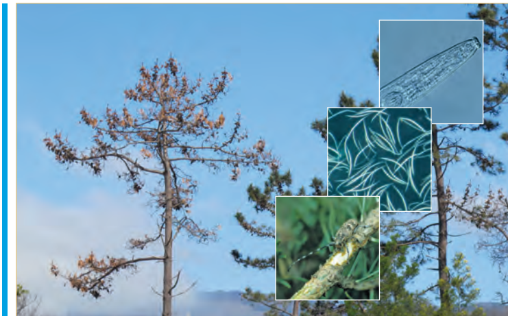
Absterbende Pinus pinaster , Vektorkäfer und Kiefernholznermatoden

Bursaphelenchus xylophilus (Steiner & Buhner) Nickle