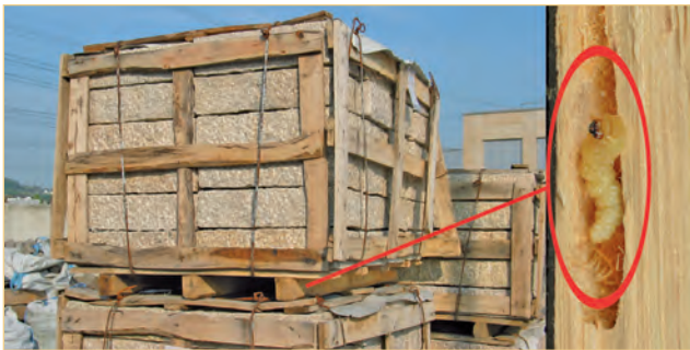
Holzverpackungen um Granit aus Asien als Risikomaterial für die Verschleppung des Kiefernholznermatoden und seiner Vektorkäfer

Der Kiefernholznermatode wurde zu Beginn des 20. Jahrhunderts aus Nordamerika nach Asien verschleppt und in 1999 auch in der EU in Portugal festgestellt. Mit Zunahme des Welthandels im Rahmen der Globalisierung hat sich Verpackungsholz als Hauptrisiko material für dessen Verschleppung herausgestellt.