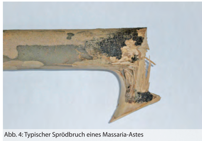
Abb. 4: Typischer Sprödbbruch eines Massaria-Astes