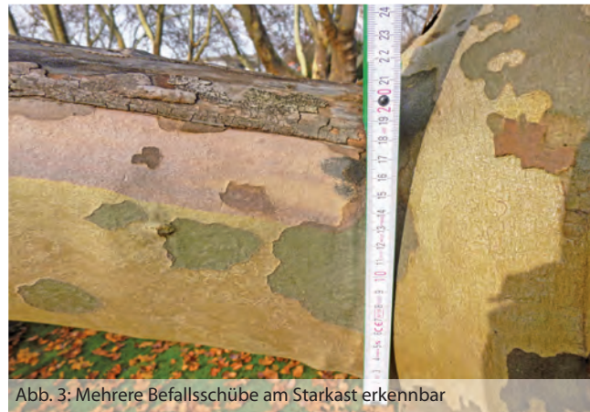
Abb. 3: Mehrere Befallsschübe am Starkast erkennbar