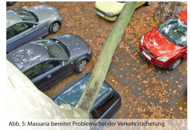
Abb. 5: Massaria bereitet Probleme bei der Verkehrssicherung

Ein Absterben ganzer Bäume konnte bisher nicht beobachtet werden. Ein Befall des Stammes stellt eine absolute Ausnahme dar.