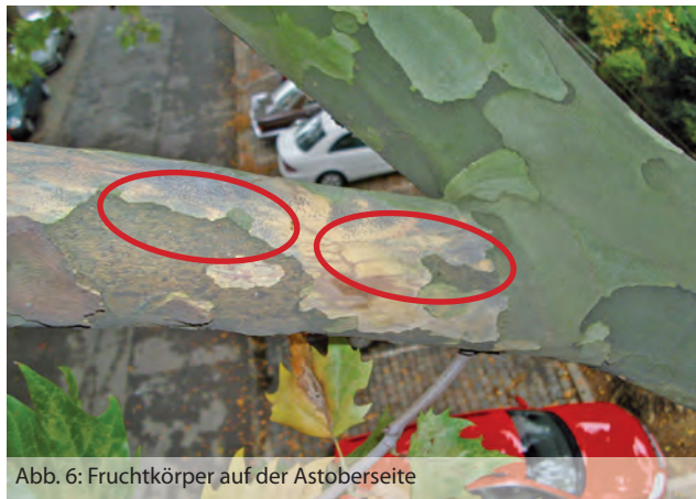
Abb. 6: Fruchtkörper auf der Astoberseite

Von einer vorsorglichen Kappung der Platanen ist aus fachlicher, baumbiologischer und stadtgestalterischer Sicht abzusehen.