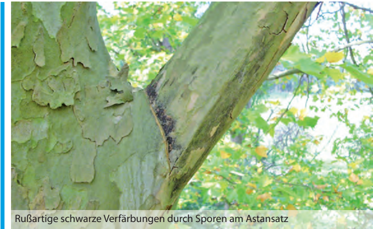
Rußartige schwarze Verfärbungen durch Sporen am Astansatz

Auslöser der sogenannten Massaria-Krankheit ist der Pilz Splanchnonema platani (früher: Massaria platani (Ces.)), der zur Familie der Schlauchpilze (Ascomyceten) gehört. Er tritt an Platanen ( Platanus spp.), vorwiegend an älteren Bäumen ab ca. 40 Jahren, auf. Platanen gelten als äußerst widerstandsfähig gegenüber Stressfaktoren im städtischen Umfeld und sind daher beliebte Stadtbäume. Sie prägen heute das Bild vieler Kommunen, allerdings befinden sich zahlreiche Bäume im befallsanfälligen Alter. Als Folge des Pilzbefalls kann es zum Absterben von Zweigen und Ästen sowie deren Bruch und damit zu erheblichen Problemen im Hinblick auf die Verkehrssicherheit kommen.