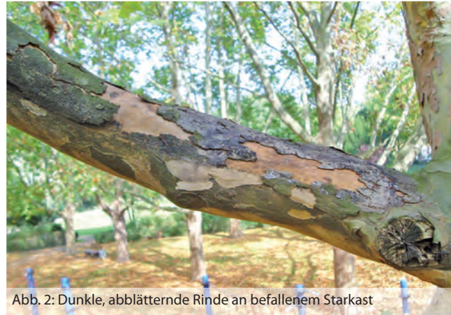
Abb. 2: Dunkle, abblätternde Rinde an befallenem Starkast